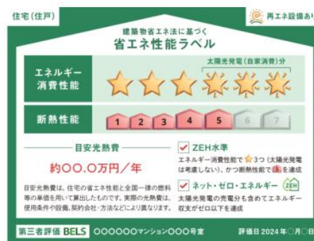
省エネ性能ラベル（見本）