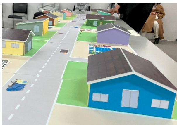
参加者が作成した間取りと街並み