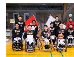
▲車いすバスケット大会