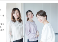
プロジェクトメンバーの笑顔

このプロジェクトは、働く女性応援イベントの運営や起業者支援を 行う「Lady★Go」と、女性活躍推進のフロントランナーである 「ケアイスター不動産株式会社」そして、本庄市役所による共 同プロジェクトです。