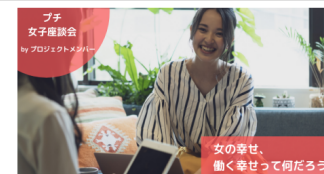
女の幸せ、 働く幸せって何だろう?